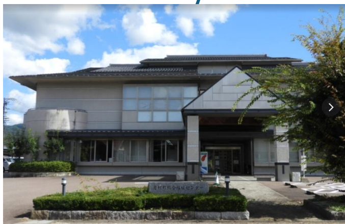
会場周辺図 岩村福祉センター